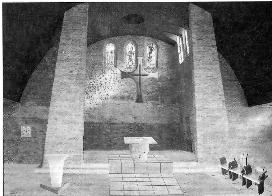
Le futur projet d'aménagement est en cours de conception (vue d'artiste).

Pratique : Pour plus de détails, dons et renseignements : http://eglise.urville.nacq.free.fr