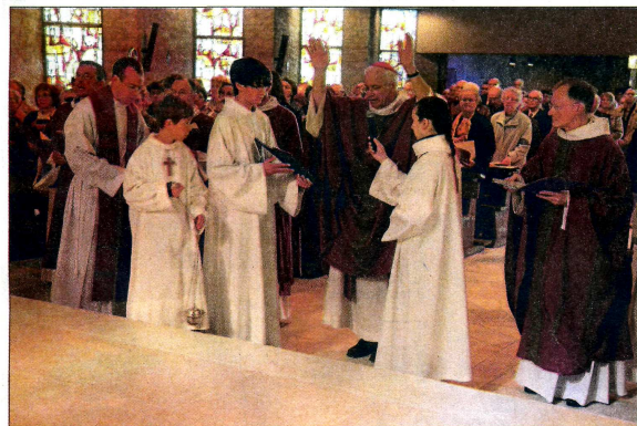
La Croix est le premier élément du mobilier à être béni par Monseigneur Stanislas Lalanne.