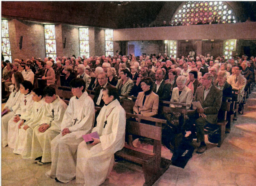
De nombreux fidèles sont venus assister à la consécration du nouvel autel et à la bénédiction du nouveau mobilier.

« Seigneur, Père de tous les saints, tu as voulu que la croix de ton fils soit la source de toute bénédiction et la cause de toute grâce. » Le siège de présidence puis l'ambon où est proclamée la parole de Dieu et qui est sculpté dans la même pierre que l'autel, le marbre de Carrare, étaient ensuite inaugurés. Chaque élément du nouveau mobilier était ainsi béni avant son usage sacré.